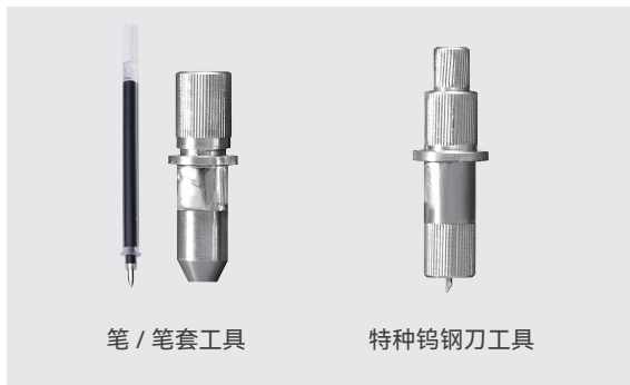
笔 / 笔套工具