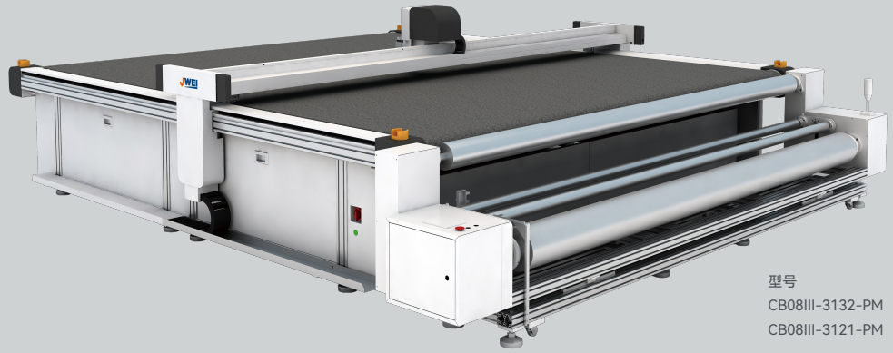
型号 CB08III-3132-PM CB08III-3121-PM